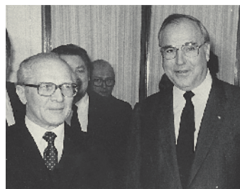
Erich Honecker mit dem CDU-Chef und späteren Kanzler.