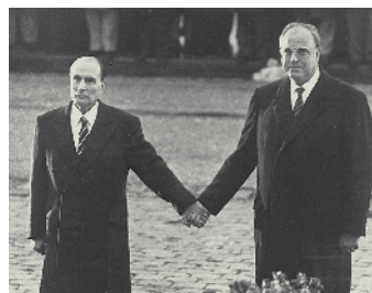
Frankreichs Präsident Mitterrand war bloß ein „Freund“.