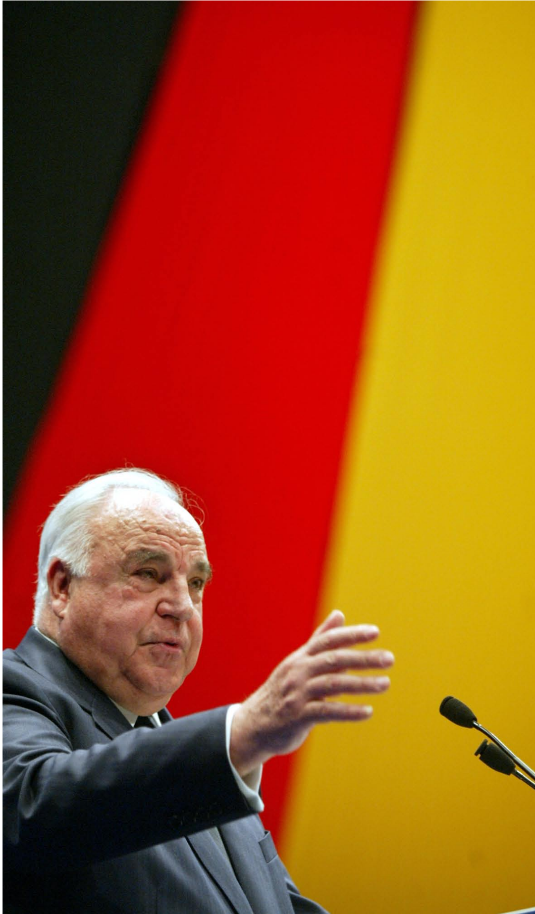
Helmut Kohl war 16 Jahre lang Kanzler der Bundesrepublik Deutschland.