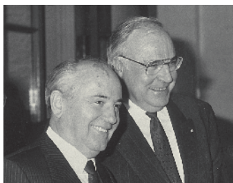
Michael Gorbatschow und Kohl wurden echte Freunde.

Mitte der 80er-Jahre belastet Kohl das deutsch-sowjetische Verhältnis schwer, als er in einem Interview Michail Gorbatschow in einen engen Zusammenhang mit NS-Propagandaminister Joseph Goebbels stellt. 1988 stattet Kohl Moskau einen offiziellen Besuch ab. Zwischen ihm und Gorbatschow gibt es wieder eine Annäherung. Im Oktober 1989 kommt es in Leipzig im Anschluss an die Montagsgebete erstmals zu Protestkundgebungen. Das Ende der DDR beginnt. Am 9. November fällt die Mauer. Das Volk jubelt Kohl zu.